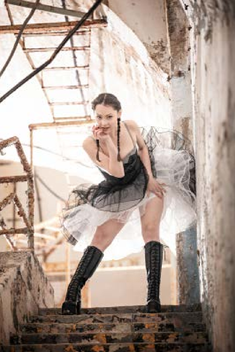
Bei den Porträts in einer Bunkeranlage hat das 70-200mm F2.8 DG OS HSM | Sports für beeindruckende Ergebnisse gesorgt. Kröher war begeistert von der Leistung seines neuen Brot-und-Butter-Werkzeugs. 1/200 s, f/2.8, ISO 800, 166mm.

„Das 70-200mm Sports hat die fantastische Lichtstimmung perfekt eingefangen. Das stabilisierte Tele-Zoom ist mein neues Brot-und-Butter-Werkzeug.“