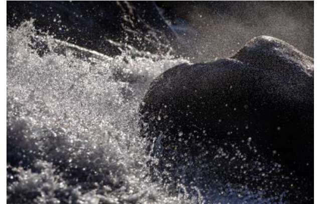
Im Maggiatal hat Kröher trotz eiskalter Umgebungstemperaturen wunderschöne Aufnahmen dieser ursprünglichen Landschaft geschossen. Wichtig war ihm hier vor allem der zuverlässige Wetterschutz des Objektivs. 1/8000 s, f/4.0, ISO 160, 114mm

inklusive drei SLD-Glaselementen (Super Low Dispersion) und vier asphärischen Linsen – die für eine beeindruckende Abbildungsleistung sorgen. Der vollformat-taugliche Allrounder ist zudem mit einem Bildstabilisator und einem Ultraschallmotor ausgestattet.