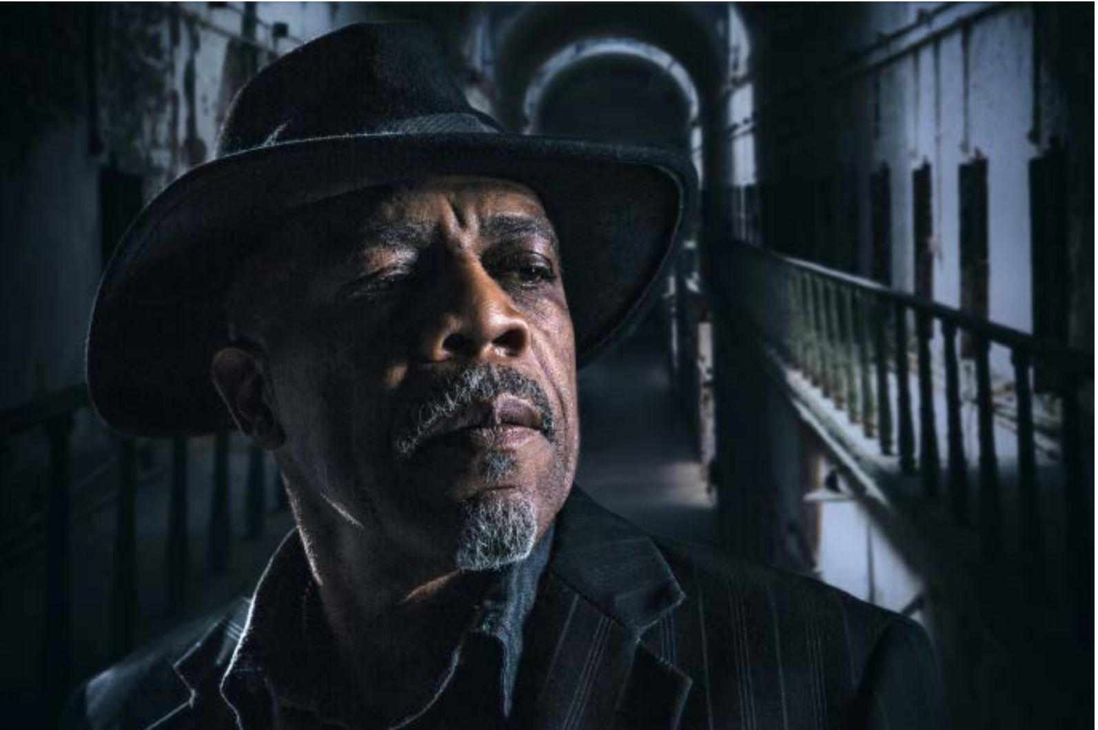
„Das 24-70mm F2.8 DG OS HSM | Art ist für mich der Allrounder schlechthin. Ein absolutes Immer-Drauf, das sich praktisch für jede Situation eignet“, schwärmt der Pfälzer. Hier etwa bei einem Porträt-Shooting. 1/160 s, f/7.1, ISO 200, 64mm.

den Wasser arbeiten. Dabei hat mich vor allem die Schärfe beeindruckt, die das Telezoom einfangen hat“, so Kröher.